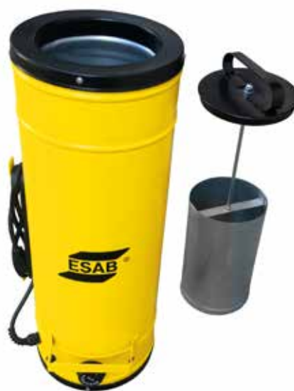
PSE-10 с изваждащ се държач за електроди